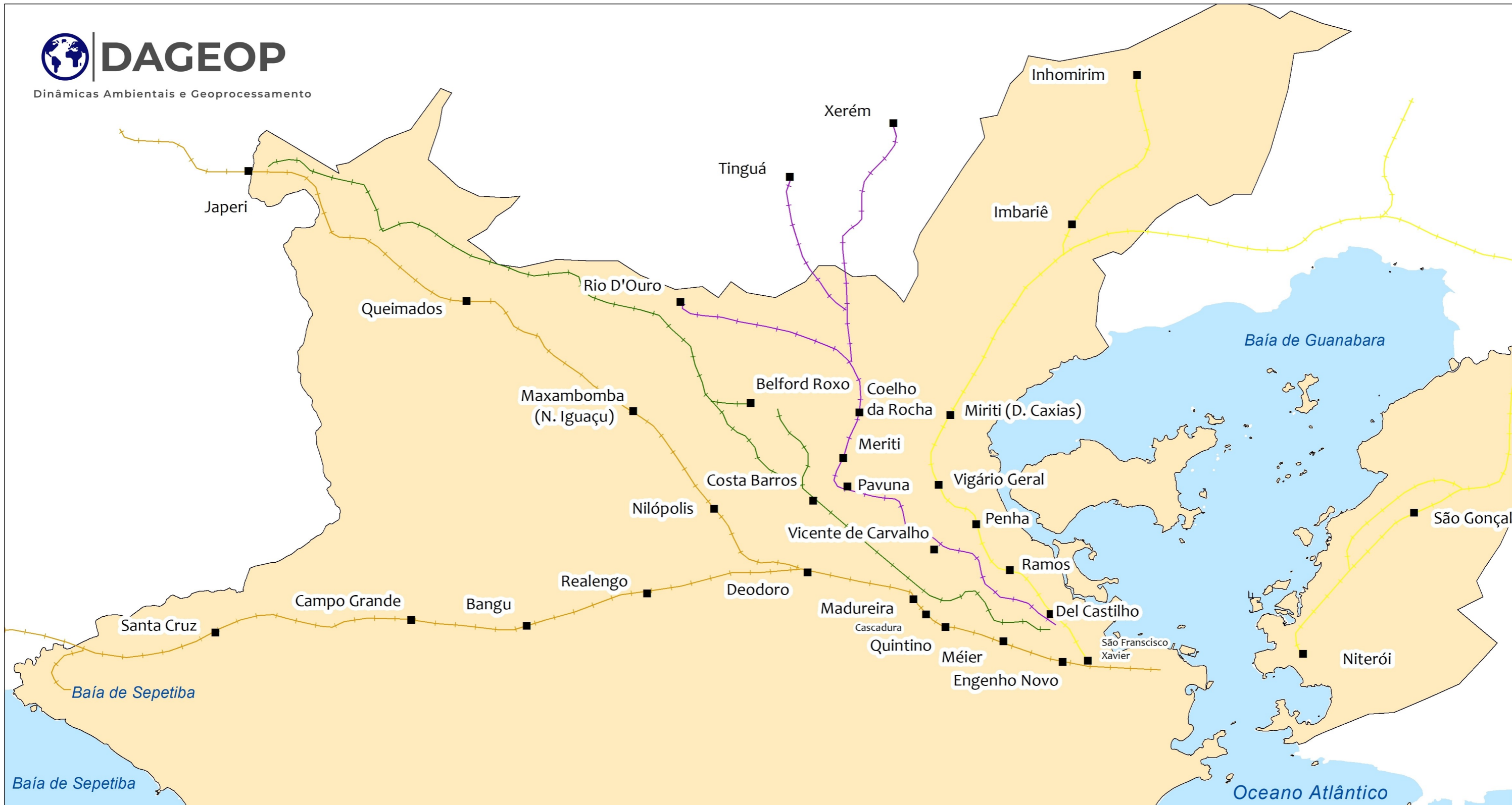
MAPA DAS ESTRADAS DE FERRO DA ÁREA CONURBADA DO RIO DE JANEIRO EM 1890